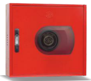
Mod. VERSAL R