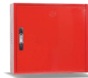
Mod. VERSAL C