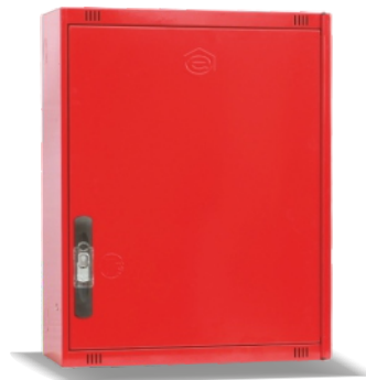
Mod. 530 C Mod. 530 CT45