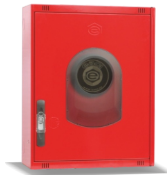
Mod. 530 R Mod. 530 RT45