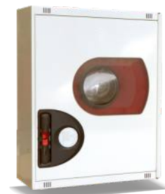
Mod. 690 R Mod. 690 RT45