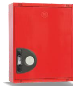
Mod. 690 C Mod. 690 CT45