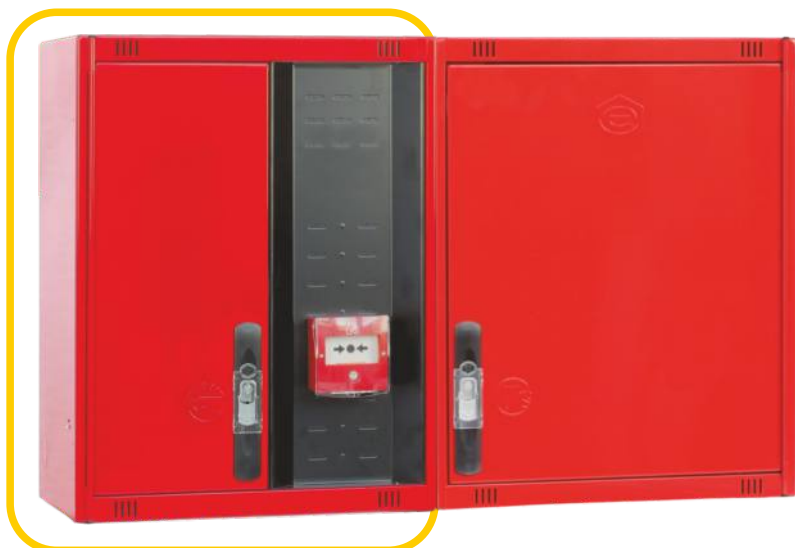
Ref. MT470C Configuración Horizontal