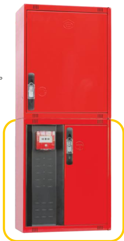
Ref. MT470C Configuración Vertical