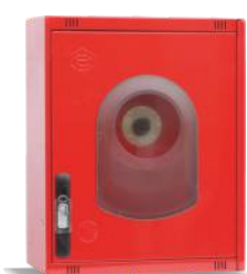
Mod. 470 R