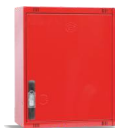
Mod. 470 C